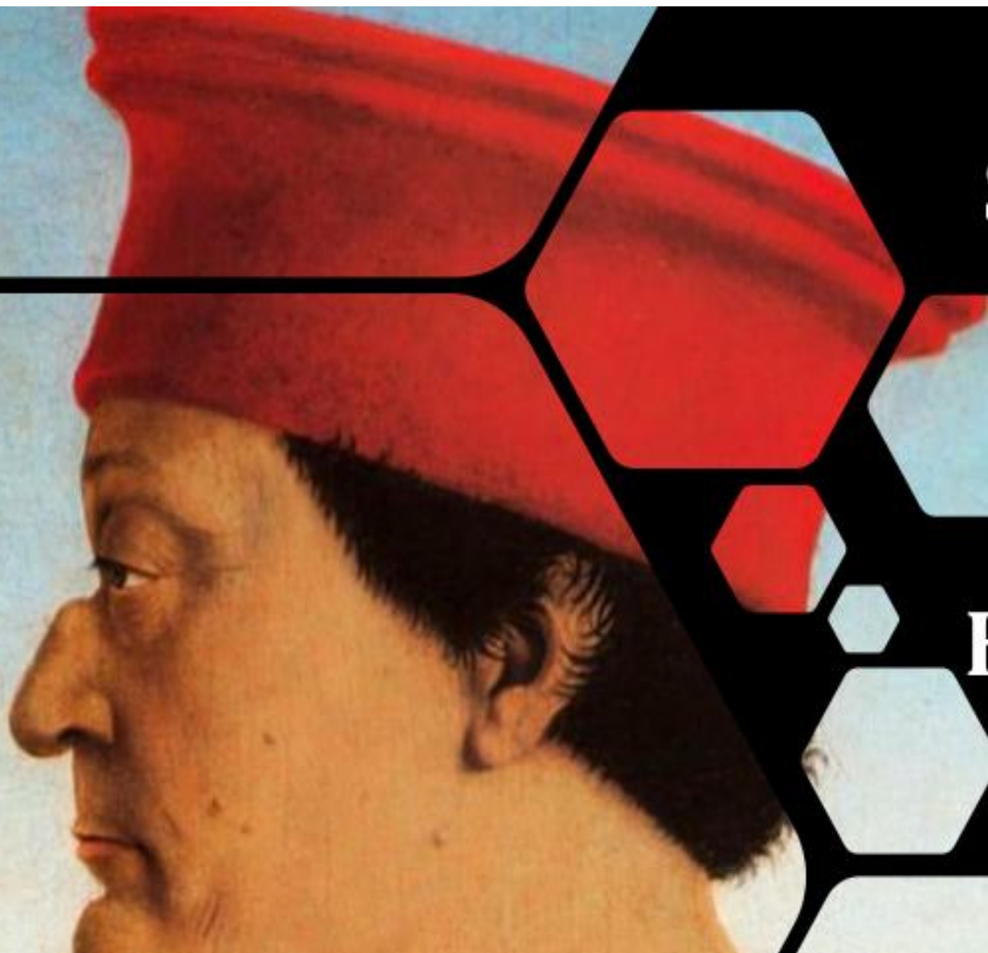
Piero della Francesca, Duc d'Urbino, Galerie des offices, Florence, 1472 (fragment)